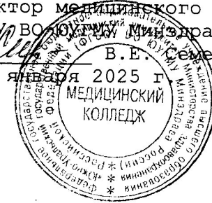
График промежуточной аттестации весенний семестр 2024/25 учебный год Специальность 31.02.02 Акушерское дело 3 курс, 6 семестр